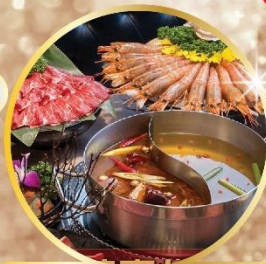
ชาบูหม่าล่าสไตส์ไต้หวัน