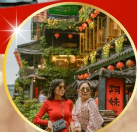
หมู่บ้านโบราณจิวเฟิน